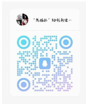
参赛报名 QQ 通知群二维码

各参赛队于截止时间前按照要求进行报名，参赛团队需指定 1 名负责人加入赛事 QQ 通知群。报名方法如下：