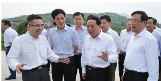
李强省长在王兴杰书记、薛安校校长陪同下视察我校青山湖校区