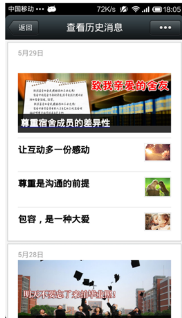
① 为“文明寝室”建设加油