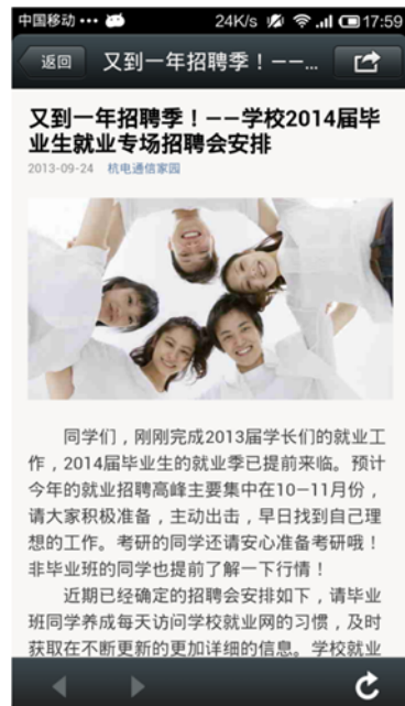
① 2014 届的学长们, 招聘季来了, 祝大家好运