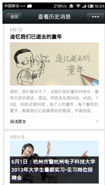
① 和小伙伴一起追忆我们逝去的童年