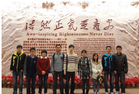
① 参观浙江革命烈士纪念馆