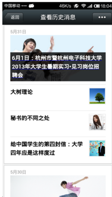
① 嗨, 小伙伴们, 该去找暑期实习单位了