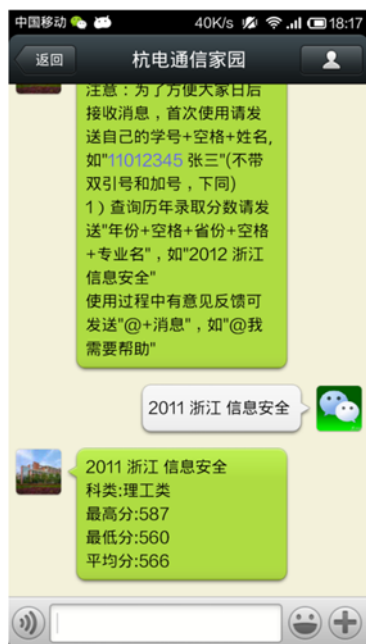
① 学生信息绑定与历年录取分数线查询