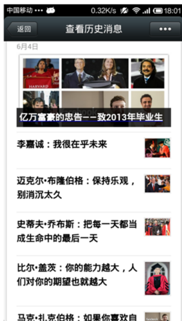
① 致2013届毕业生，祝福他们