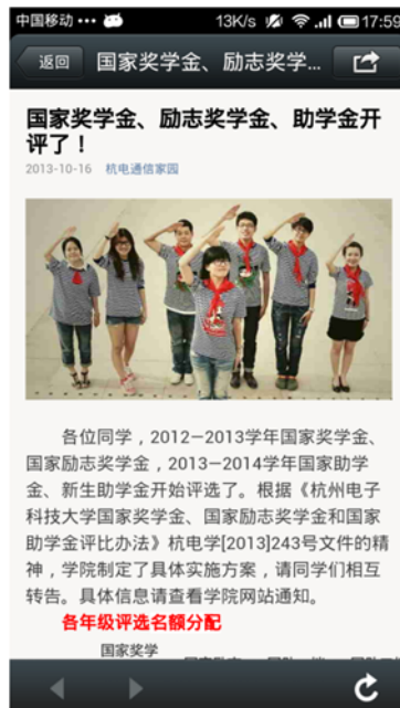
① 重要信息来了, 评选很公开、透明哦