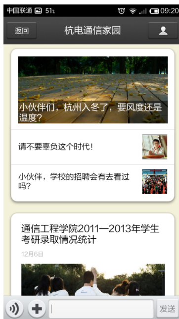
① 温馨提醒小伙伴们天冷了，该添衣服了