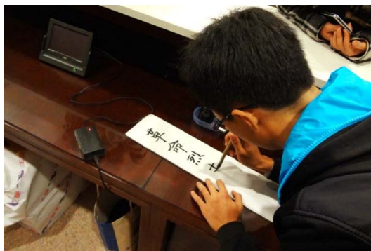
① 党员自己动笔写下挽联

的模范，我们更通过积极倡导、互帮互助将党员的先进性辐射到其他同学，党员和其他同学一起成长，共同进步！