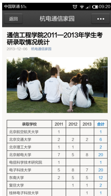
① 看看学姐、学哥考研情况，增加自己考研信心