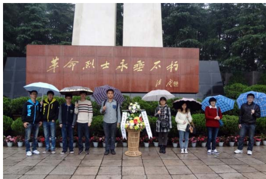
① 缅怀革命先烈 感受中国梦建设步伐